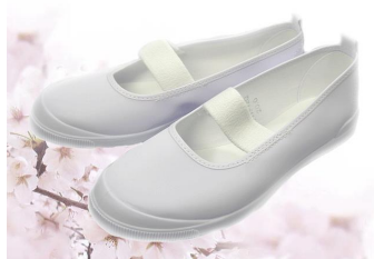
sapatilha escolar e sacola para sapatilha