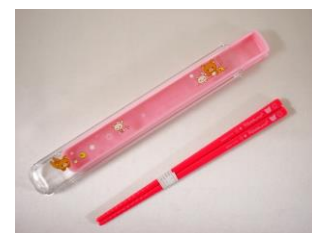
palitos para comer(hashi) e estojo para hashi