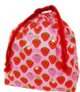
sacolinha para guardar talheres e pano