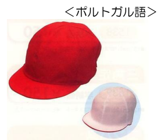
chapéu vermelho branco para Educação Física