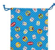
sapatilha do ginásio de esportes e sacolinha para a sapatilha