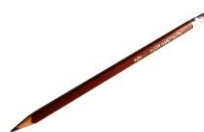
lápiz (5 tipo B e 1 vermelho)