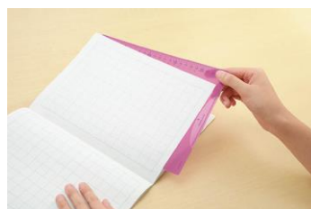
plástico duro(para no marcar las hojas del cuaderno en el momento de escribir)