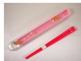
palitos para comer(hashi) con su respectivo estuche