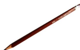
lápiz (5 lápices tipo B) y 1 rojo